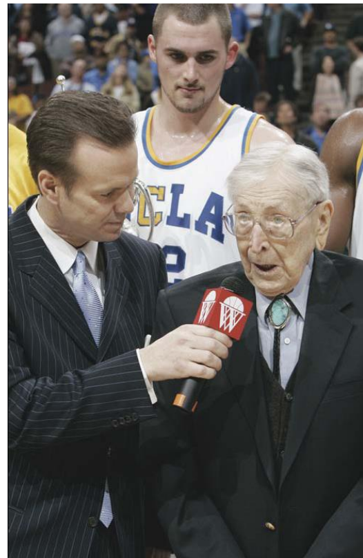
▲ Un reportero entrevista a John Wooden en la UCLA, donde fue coach desde 1948 a 1975 y ganó 10 campeonatos nacionales.

Otra técnica es escuchar . Un líder debe escuchar a aquéllos bajo su supervisión. Creo que eso se ha pasado por alto mucho. No sabemos nada que no hayamos aprendido de alguien más de una forma u otra. Y una de las formas que hacemos eso es al escuchar.